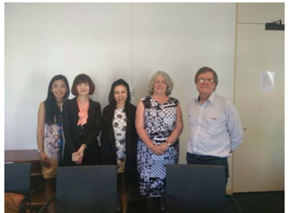
ภาพถ่ายของ Campus, University of Canberra