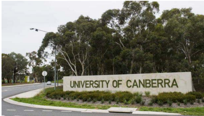
ภาพถ่ายการเข้าอบรมที่ University of Canberra